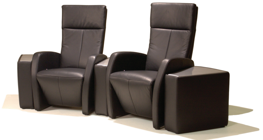
Stanley 50 met cinematafel